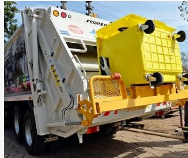
Recollida dels residus