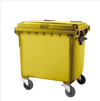
Depositar residus pels ciutadans/es.