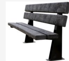
Mobiliari reciclat, reciclable instal·lat en el municipi.