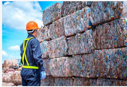
Planta de triatge Reciclatge amb residu km0